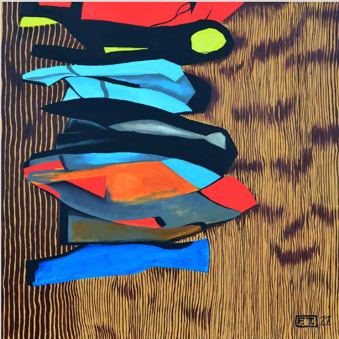
Velký bonus 2022, akryl na plátně, 100 x 100