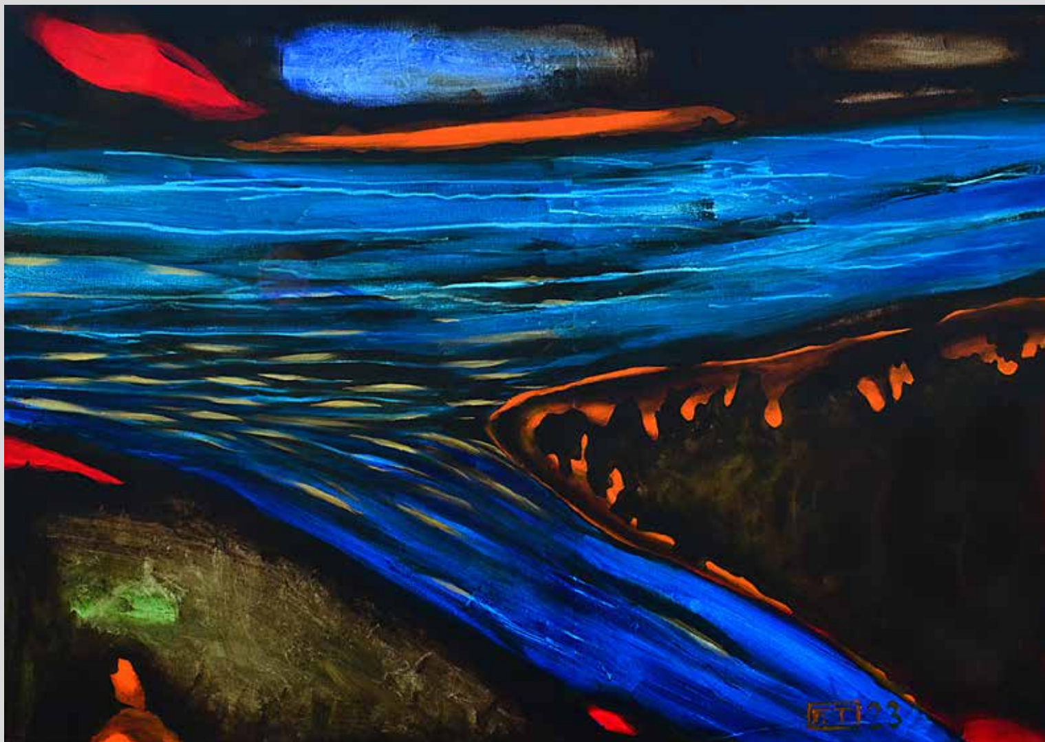
Cesta k moři 2023, akryl na plátně, 140 x 90