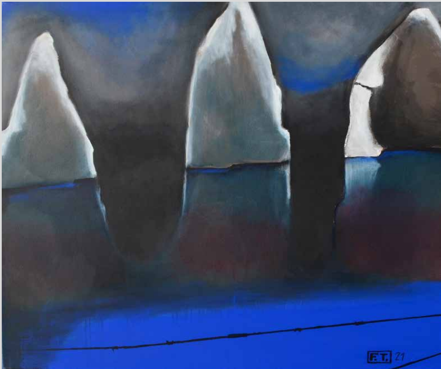
Obloha v Kaziměři 2021, akryl na plátně, 120 x 100