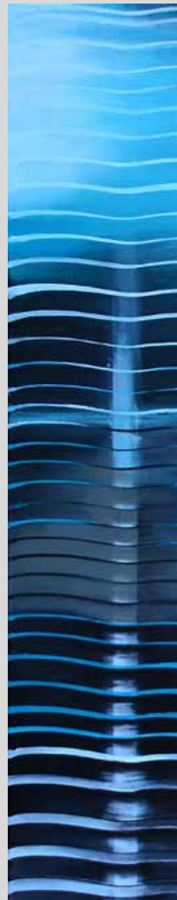
Ostrov 2024, akryl na plátně, 100 x 110