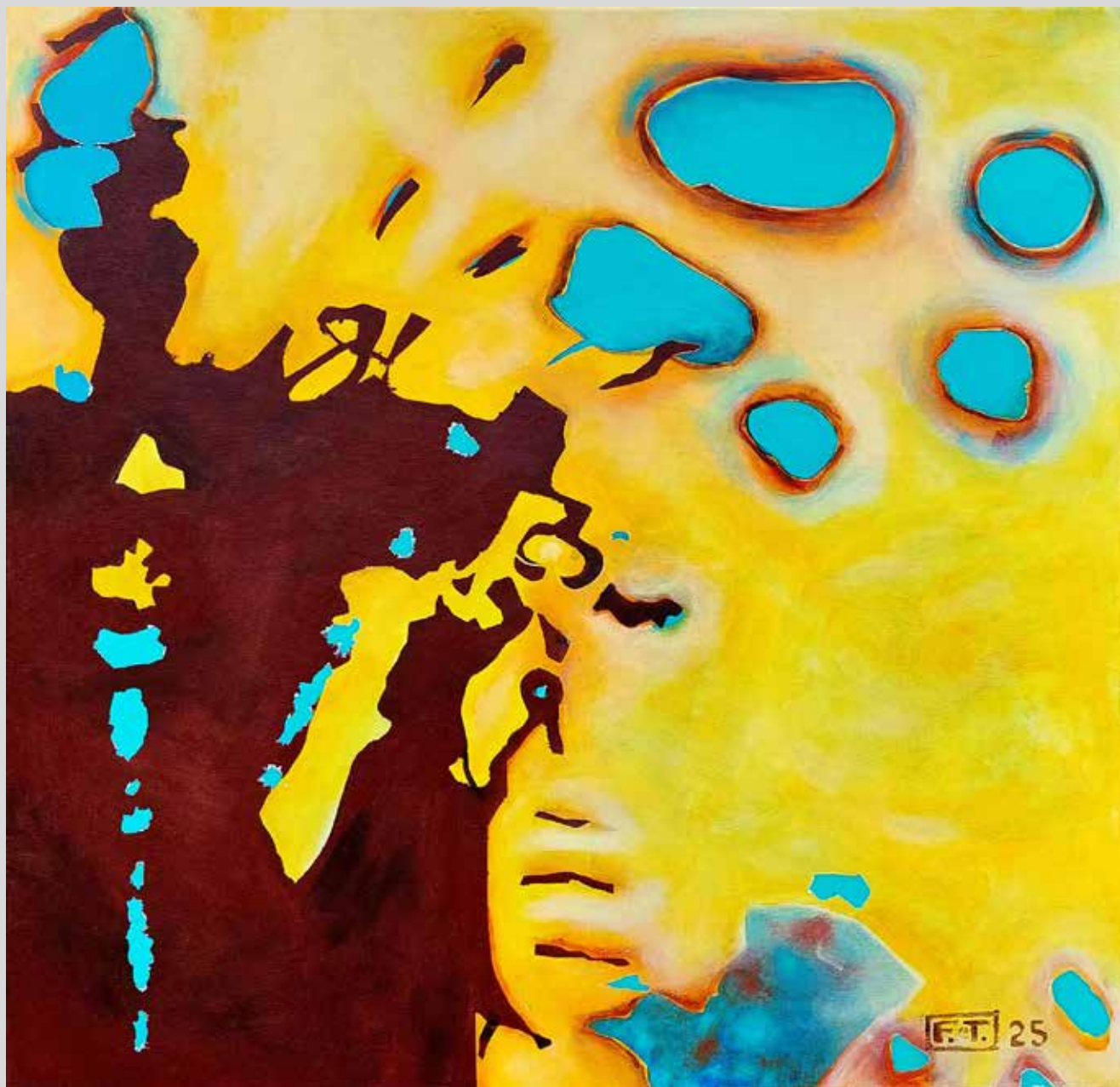
Syrakusy II. 2025, akryl na plátně, 100 x 100