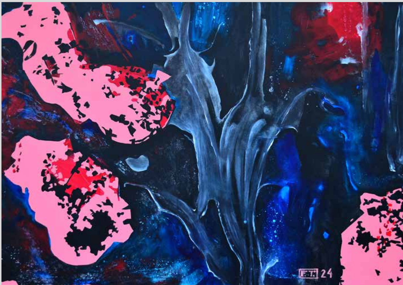
Invermes 2024, akryl na plátně, 140 x 100