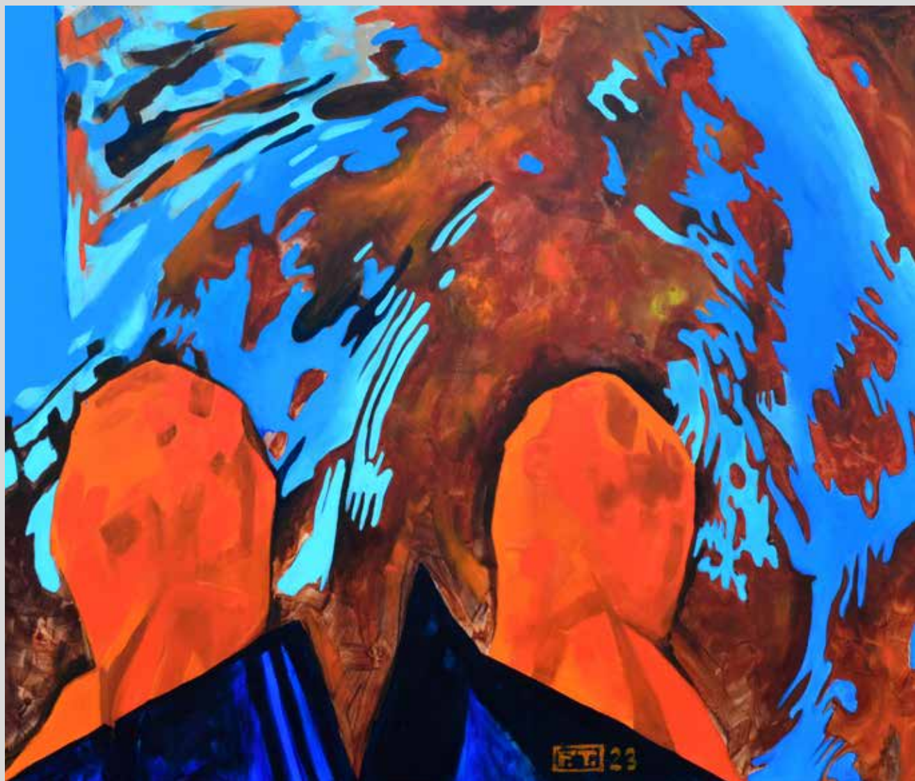
Vivat Venezia 2023, akryl na plátně, 110 x 100