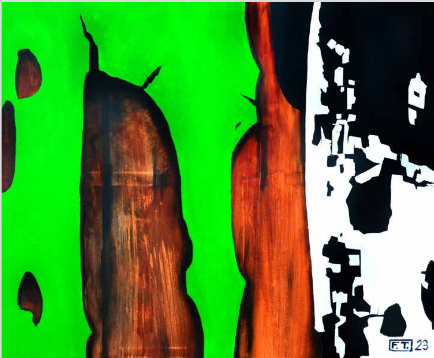
Bílá stárne rychleji 2023, akryl na plátně, 120 x 100