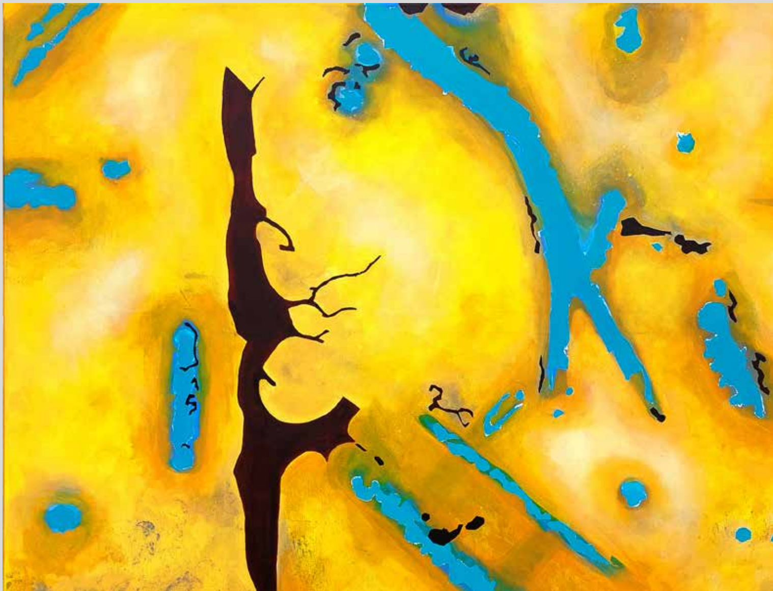
Syrakusy I. 2025, akryl na plátně, 140 x 100