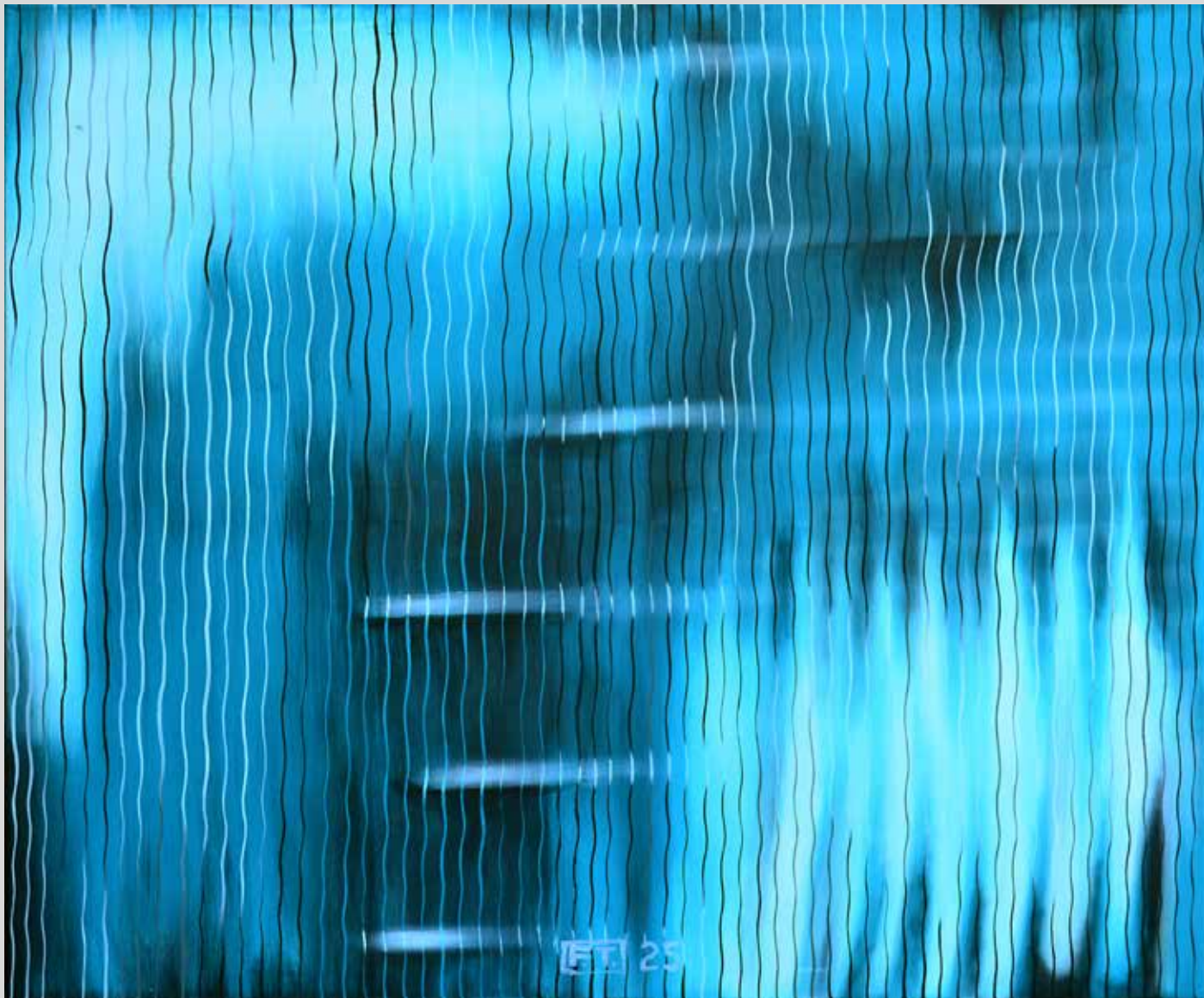
Tajemná zvířata všedních dnů II. 2025, akryl na plátně, 120 x 100