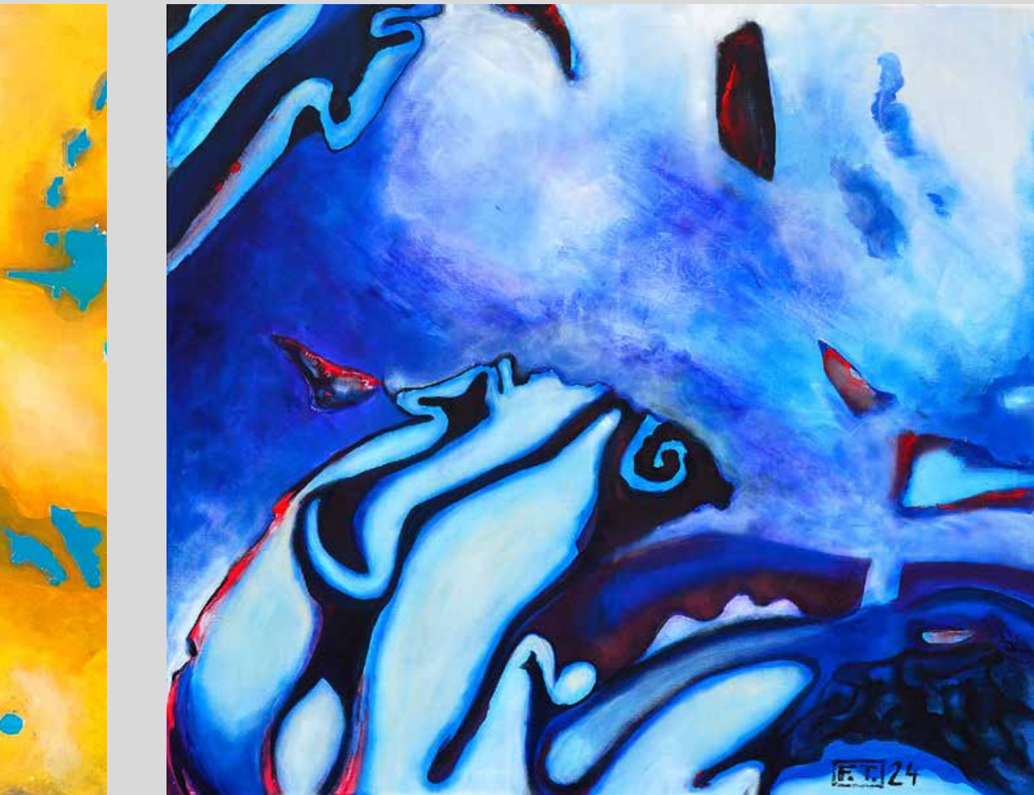
Pickles 2024, akryl na plátně, 110 x 100