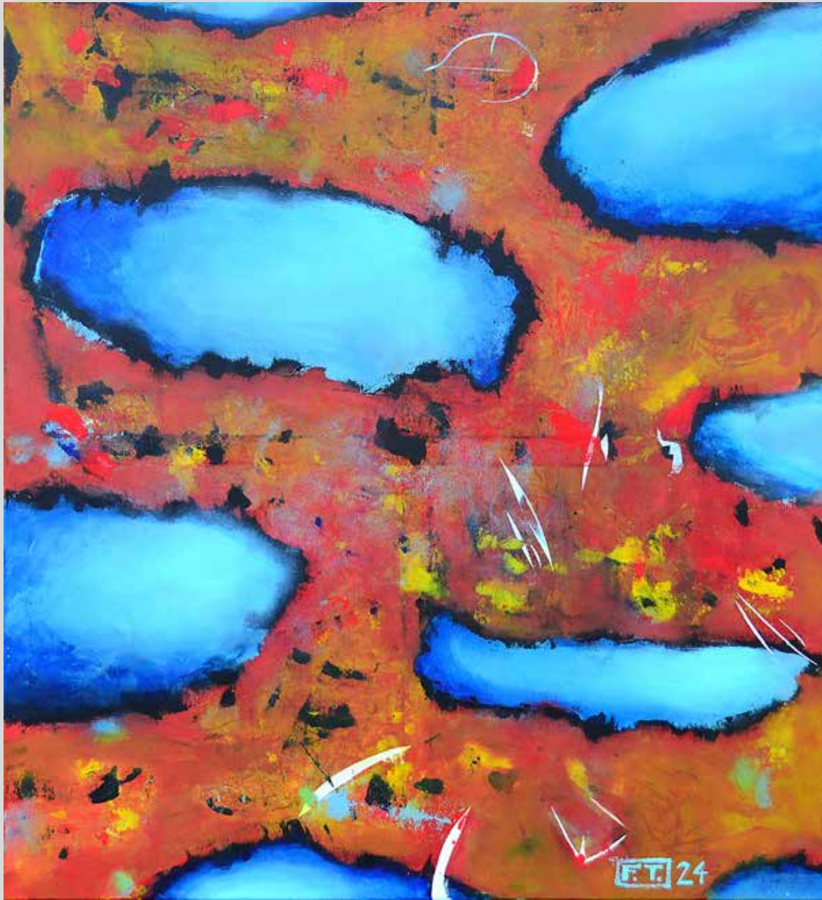
Ostrovky 2024, akryl na plátně, 100 x 110