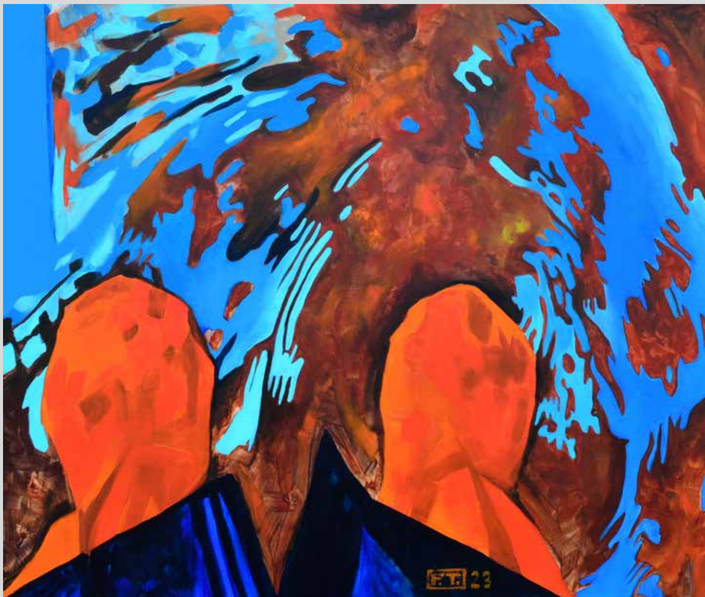
Vivat Venezia 2023, akryl na plátně, 110 x 100