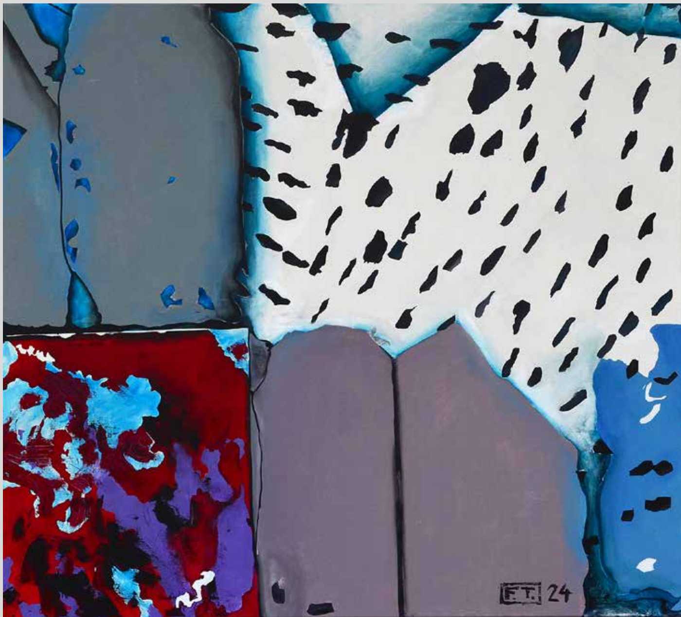
Tři generace 2024, akryl na plátně, 120 x 100