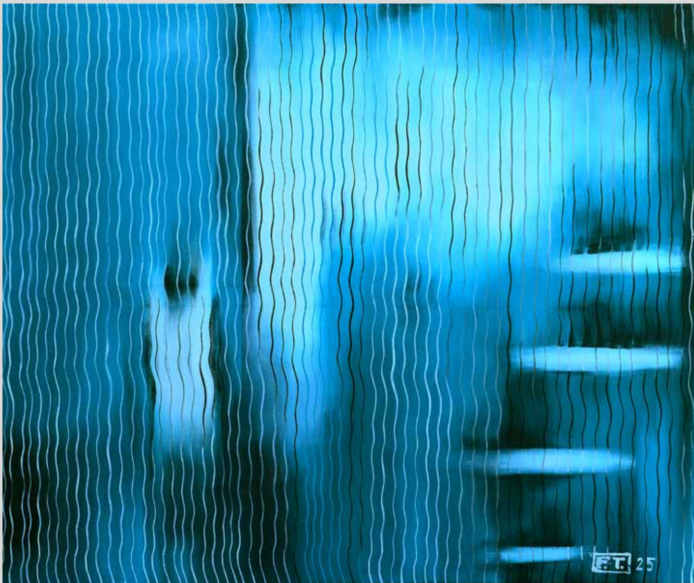
Tajemná zvířata všedních dnů I. 2025, akryl na plátně, 120 x 100