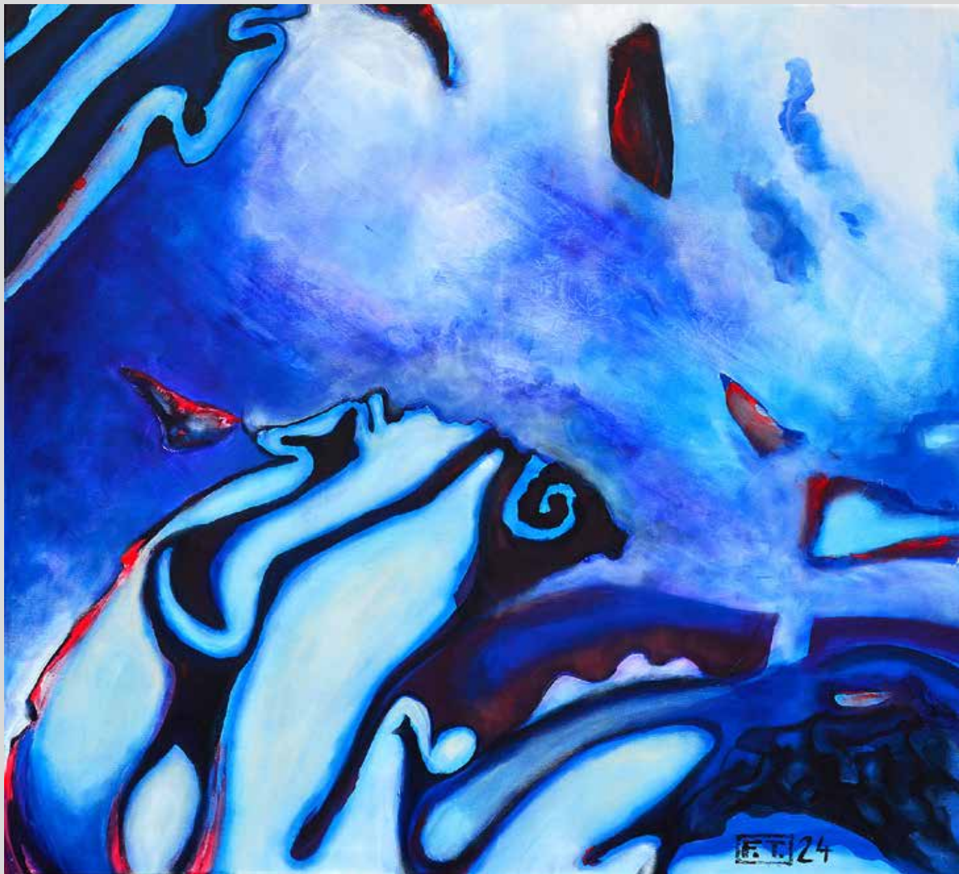
Pickles 2024, akryl na plátně, 110 x 100